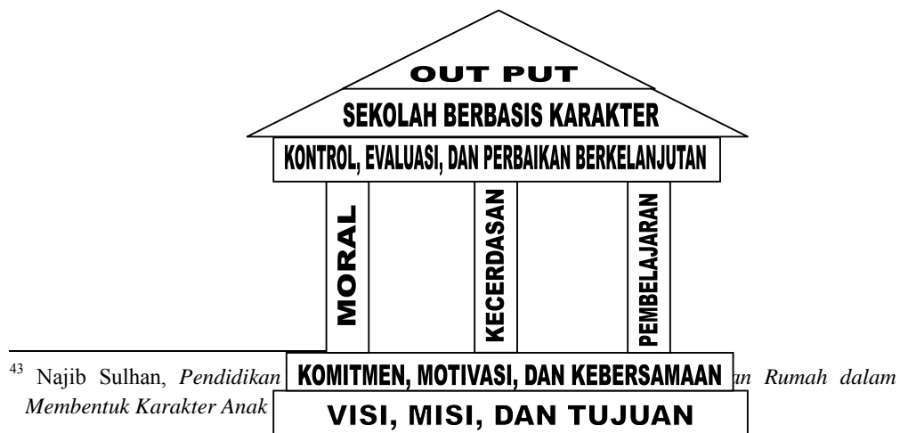
Gambar 2.2. Rumah Karakter, dikutip dari Najib Sulhan, 2010

Dalam membangun karakter pendidikan di sekolah, ada tiga pilar yang perlu dijadikan pijakan. Ketiga pilar memadukan potensi dasar anak. Keterpaduan pilar yang ada dapat dilihat pada gambar rumah karakter berikut. 43