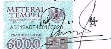
Siti Khofiyah NIM.B03210007