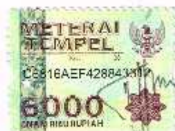
Toha maksu NIM. C03213054

Surabaya, 19 Juni 2017 Saya yang menyatakan,