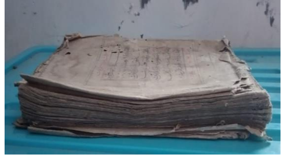
Lampiran 3. Bagian sisi luar manuskrip mushaf Al-Qur'an Alaskokon