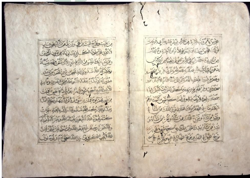
Lampiran 4. Bagian dalam manuskrip mushaf Al-Qur'an Alaskokon